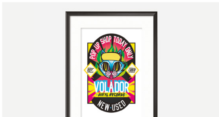
ENSEIGNES ET AFFICHES